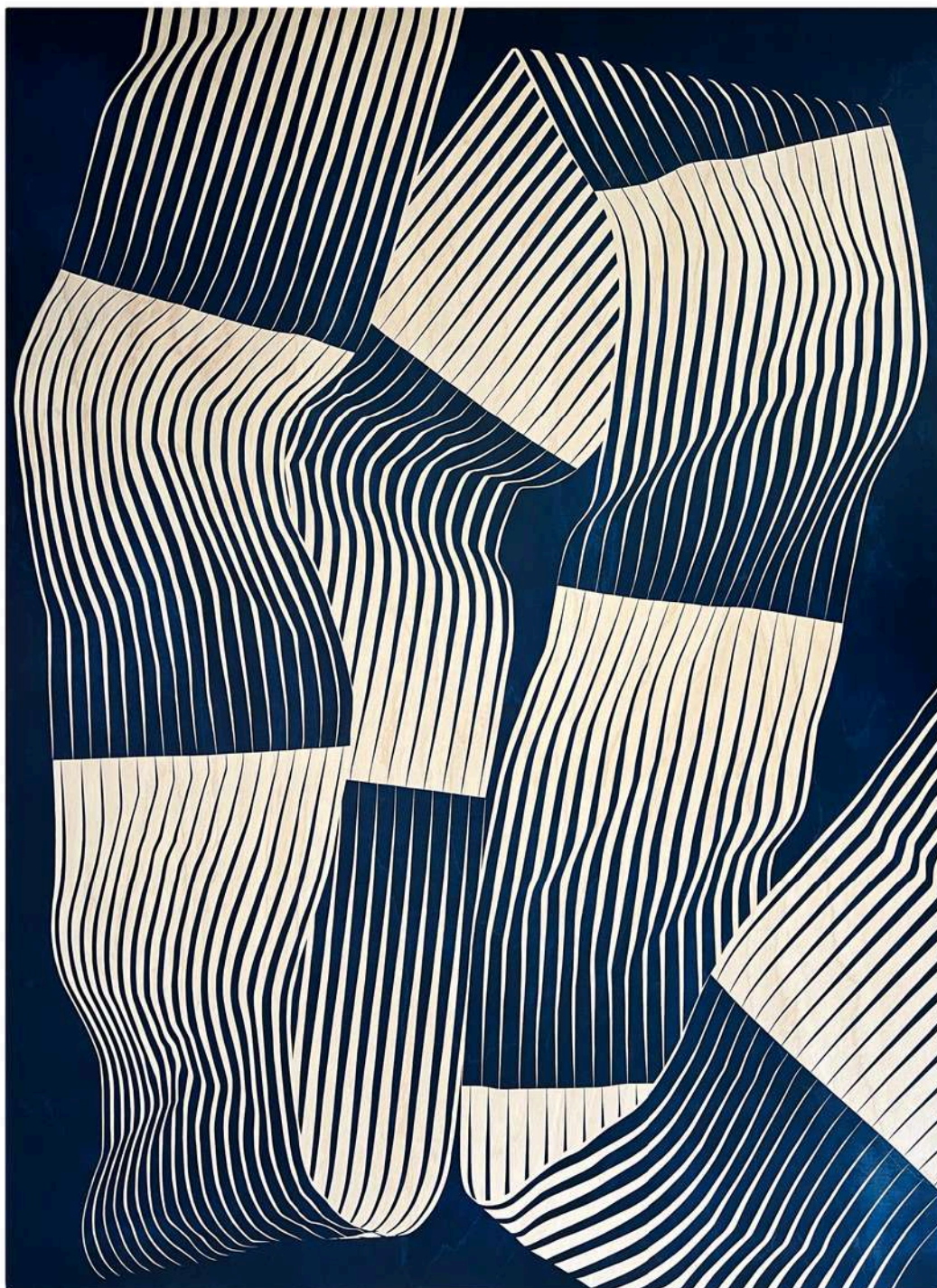
Étreinte #2, 2025 gravure sur contreplaqué de bouleau, 109,5 x 150 cm