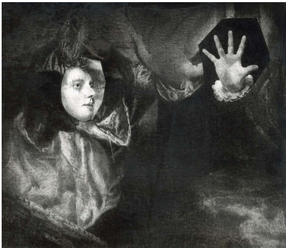
L'hypothèse des doublures 12, 2025 graphite, fusain, encre et vernis sur papier 9,5 x 8 cm