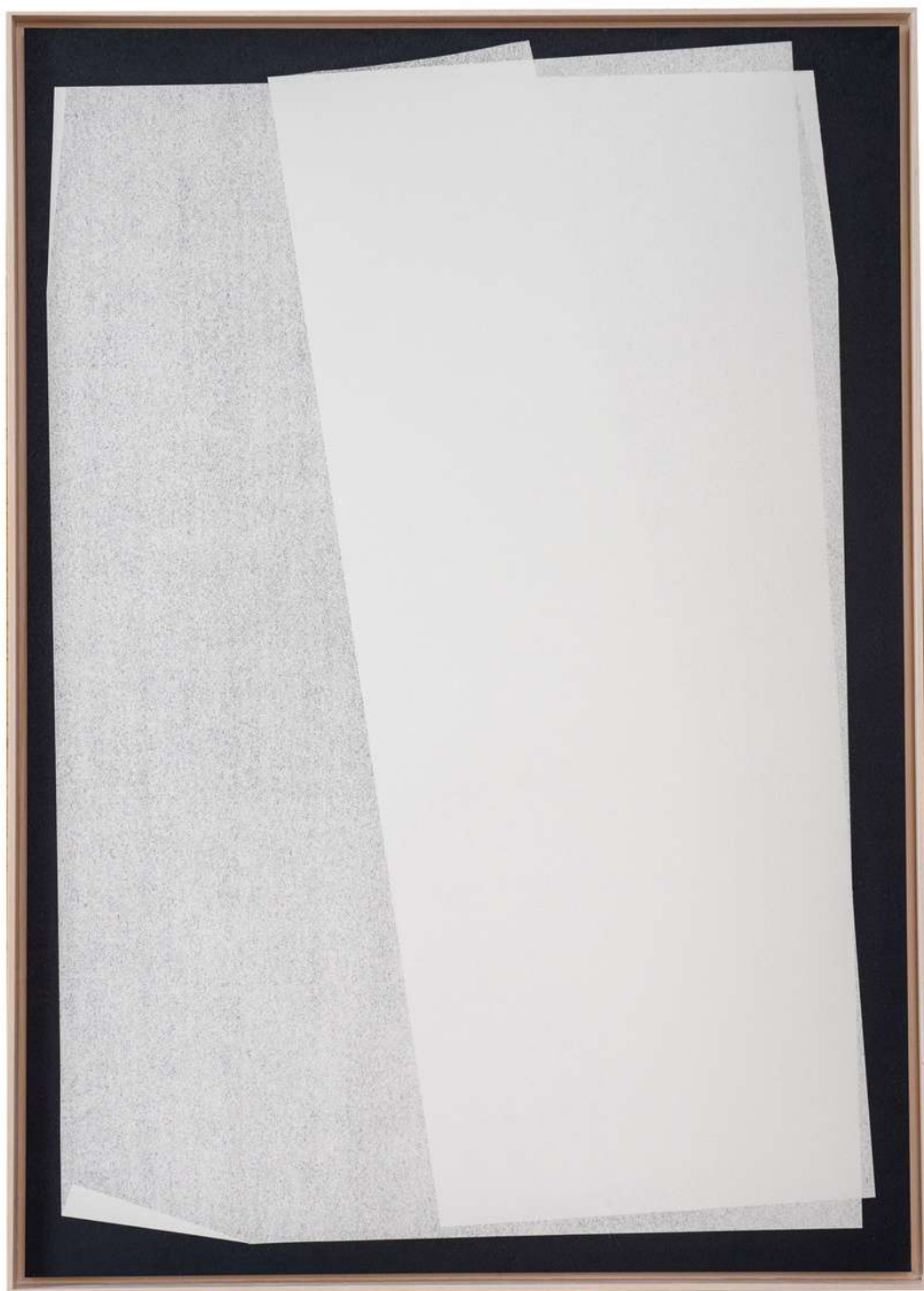
Superpositions #1, 2022 Monotype sur papier Olin blanc, naturel mat 250g 72 x 102 cm