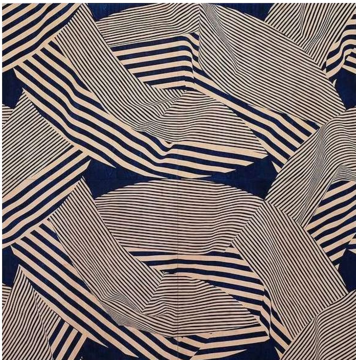
Entrelacés, 2022 Gravure sur contreplaqué de bouleau 195 x 195 cm