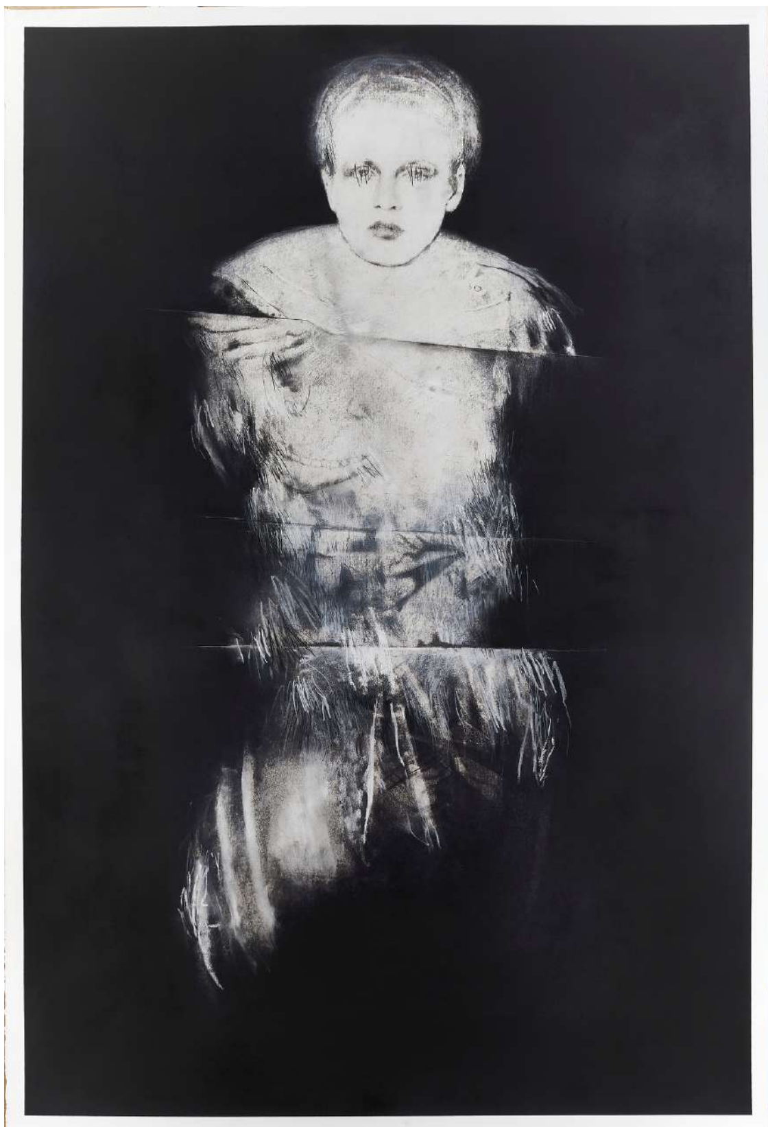
Les limites du cavalier , 2021 Sans titre 55, fusain, pastel sec, encre, graphite et vernis sur papier 160 x 108cm