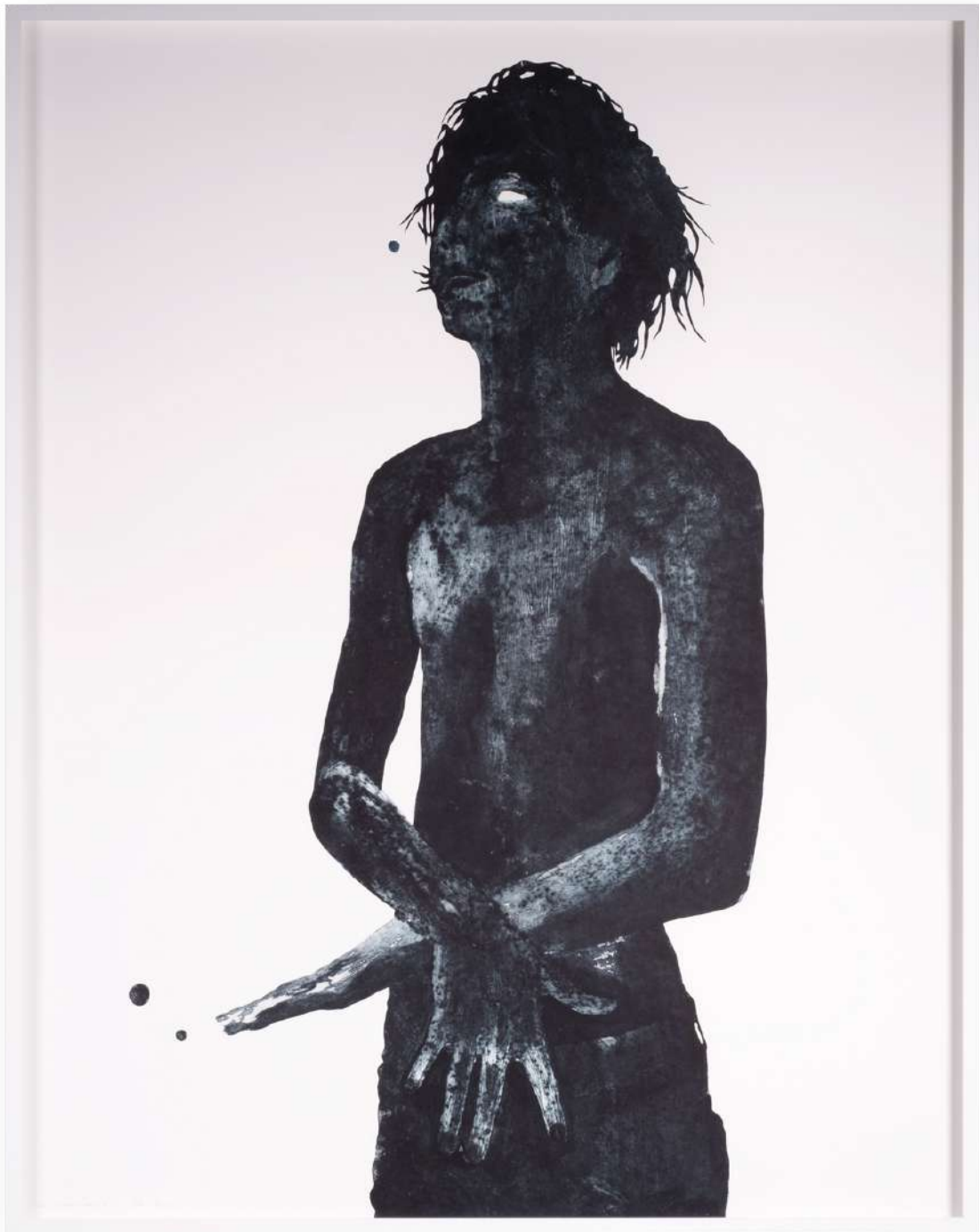
Vigie # , 2022 Gravure (variotype), édition de 4 ex 120 x 120 cm