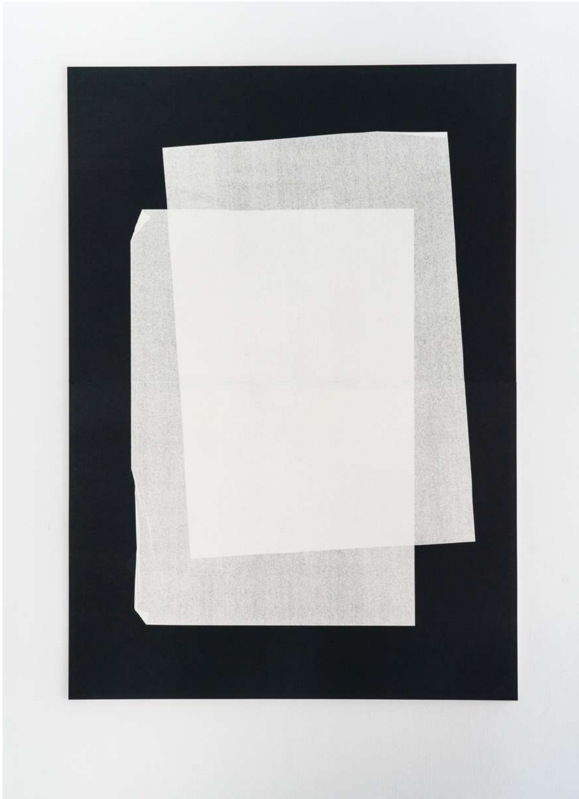
Sandra Plantiveau | Echo , 2019 Monotype sur papier Olin blanc naturel mat 250g 144 x 102 cm