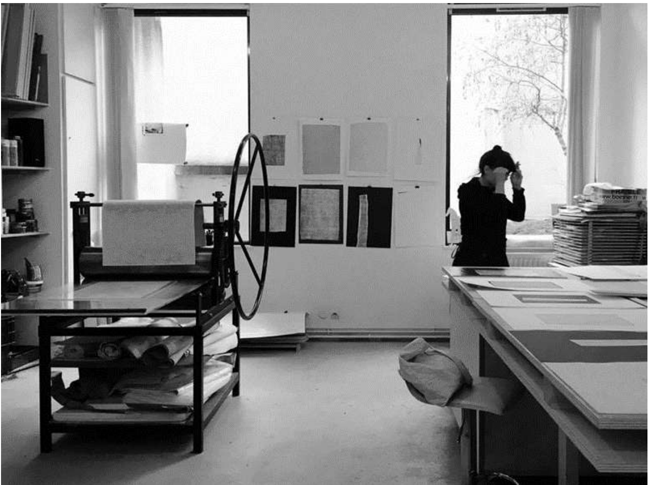
atelier de la galerie Modulab