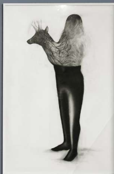
Les métamorphoses , 2010, fusain sur papier, 120 x 80 cm