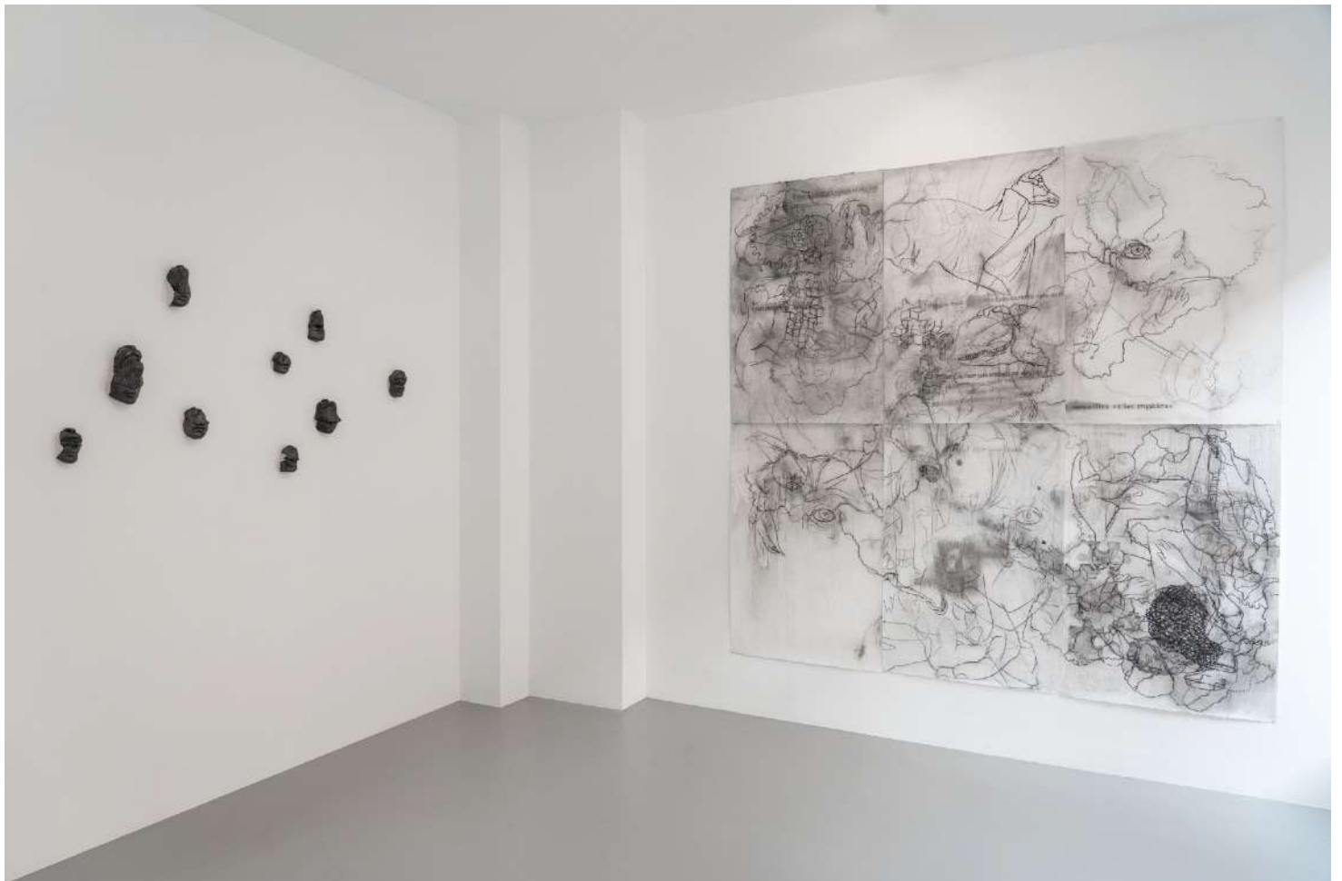
Vue d'exposition: À l'ombre des fétiches , Galerie Modulab, Septembre 2020