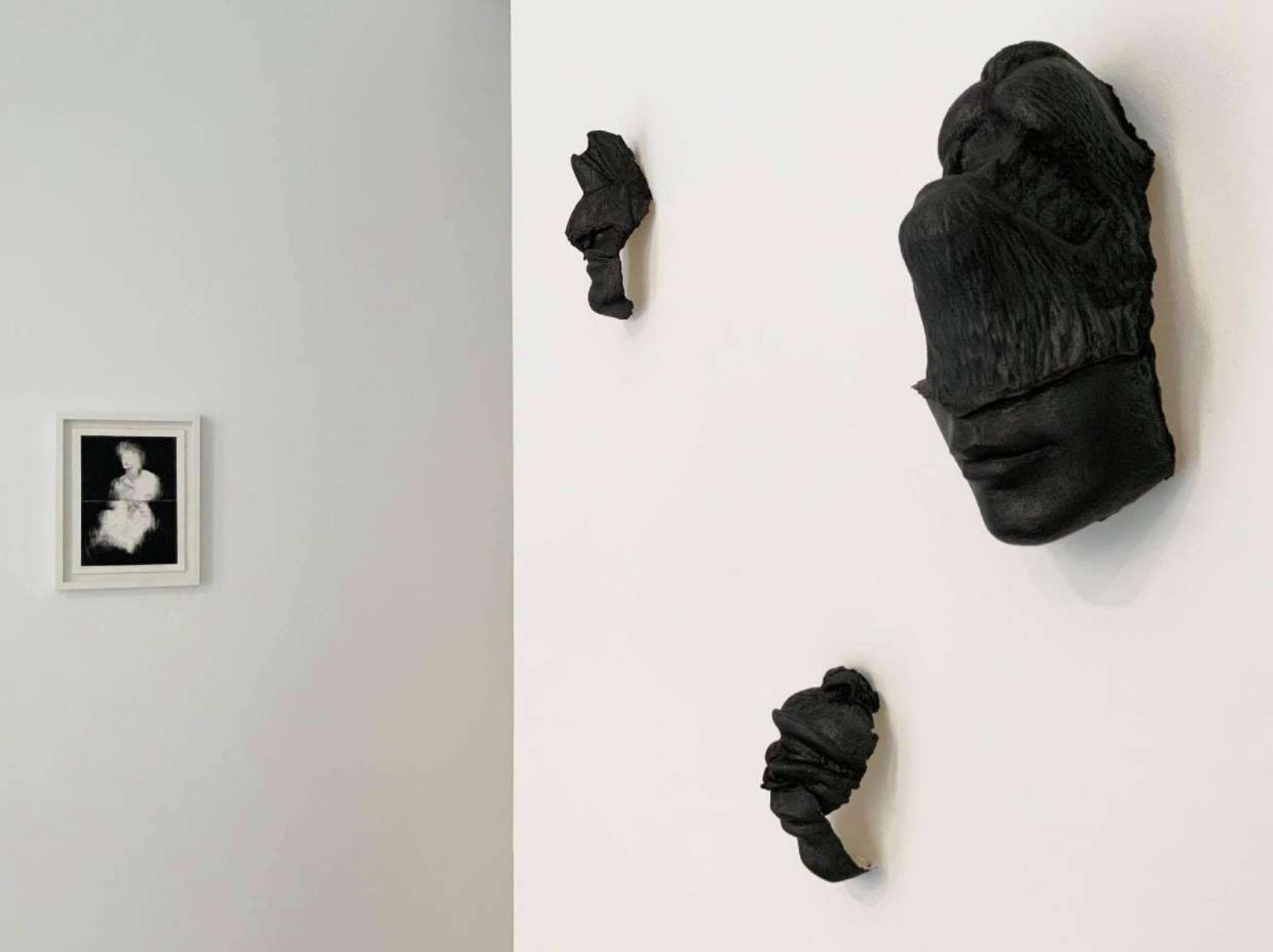
Vue d'exposition: À l'ombre des fétiches , Galerie Modulab, Septembre 2020