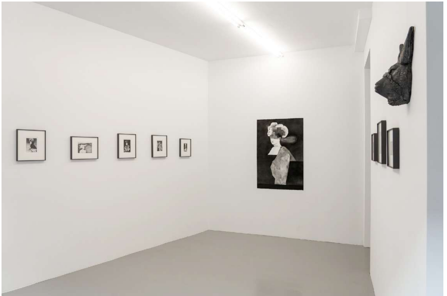
Vue d'exposition: À l'ombre des fétiches , Galerie Modulab, Septembre 2020