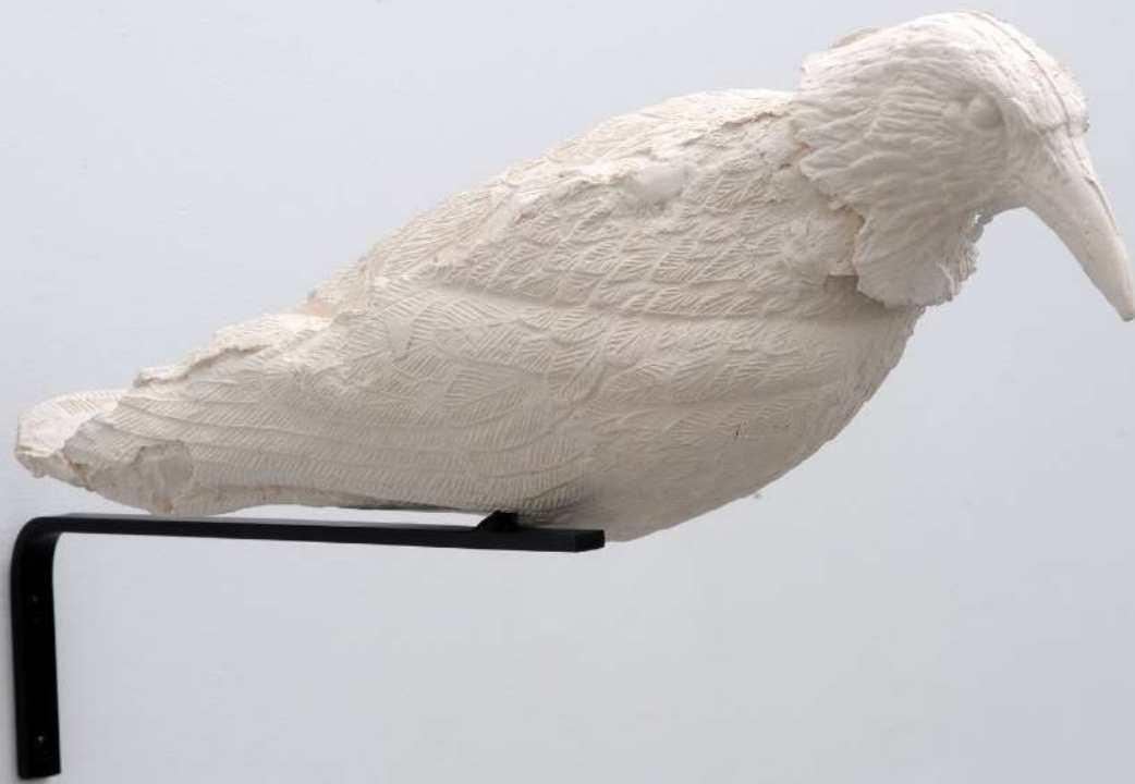
Les témoins, 2016, faïence, 30 x 11 x 12 cm