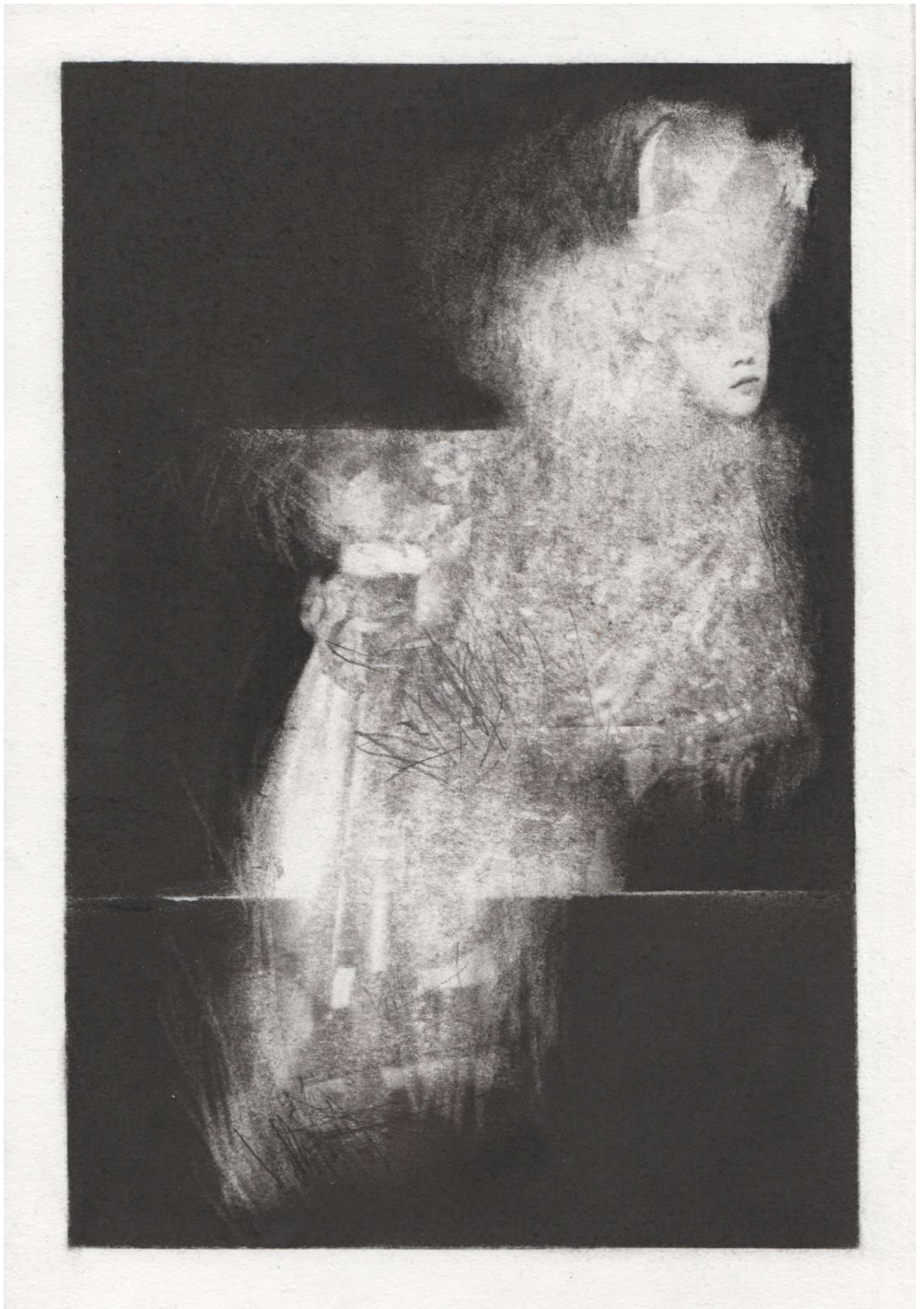
Série Les limites du cavalier n°6 , 2020, fusain et graphite sur papier, 30 x 21 cm